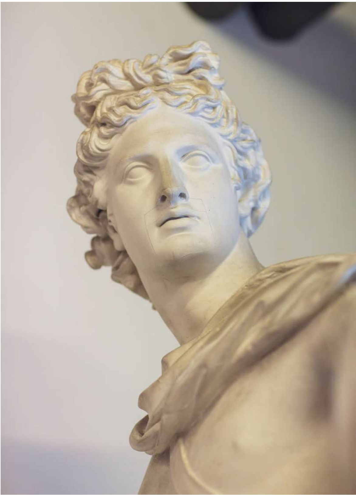
APOLLON. Kopi af Apollon fra Belvedere, der formentlig er fra 350 før vor tidsregning og nu står på Vatikanmuseet. Kopien er lavet i 1897.

Afstøbnings-samlingen er helt afgørende for vores forståelse af, hvem vi er, og hvordan vi er blevet til dem, vi er i dag, mener Bjørn Nørgaard. Det var med gipsafstøbningerne, at man befriede