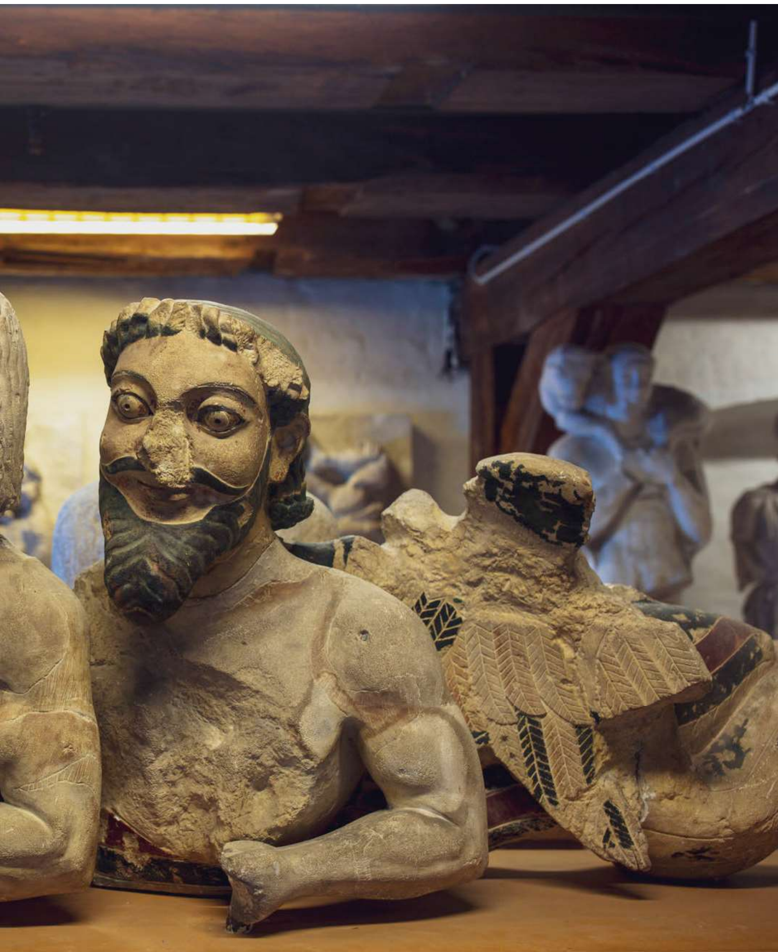
TYPHON. Kopi af skulpturgruppen, et uhyre med tredobbelt mandsoverkroppe, fra Athenatempel på Akropolis i Athen. Originalen er lavet 570-550 f.v.t., kopien er lavet i 1906 af billedhugger Anne Marie Carl-Nielsen. Hun tog til Akropolis og lavede en lerkopi af den oprindelige figur. Ud fra den lavede hun en afstøbingsform, som kunne bruges til at skabe gipskopien.