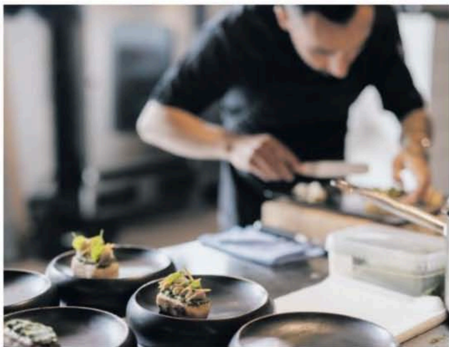
Restaurant Studio i den gamle Toldkammerbygning i Havnegade løb med sejren.

Dommerpanelet består af Helle Brønnum Carlsen, madkritiker på Weekendavisen og madanmelder for White Guide; Lærke Kløvedal, madanmelder på Politiken; Rasmus Palsgård,