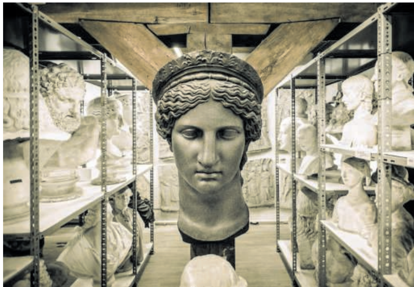
▲ Den Kongelige Afstøbningssamling, som rummer mere end 2000 værker, har siden 2016 været lukket for offentligheden grundet besparelser.